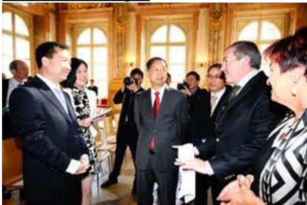
Städtepartnerschaft Salzburg-Shanghai (1)